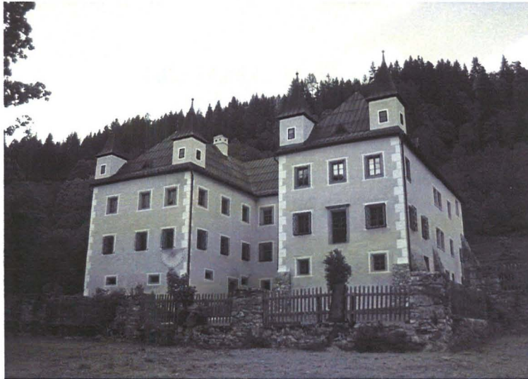
Eine Veranstaltung der Gemeinde Flachau im Schloss Höch